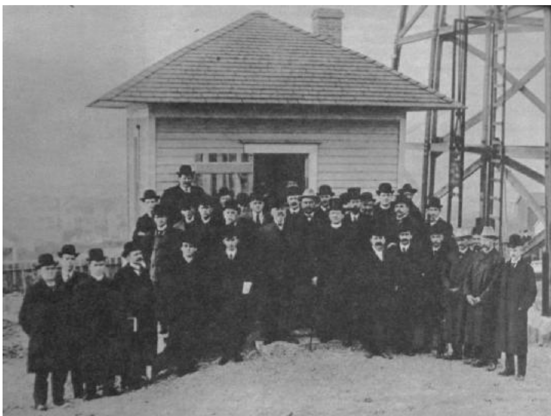
Účastníci vysielania z Murgašovej rádiostanice