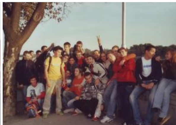
Žiaci 4.A a 4.D triedy na veľtrhu Akadémia & Vapac.